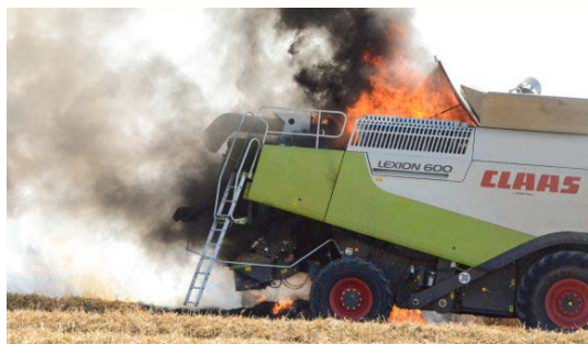
Feu de courroies échauffées sur des roulements coincés