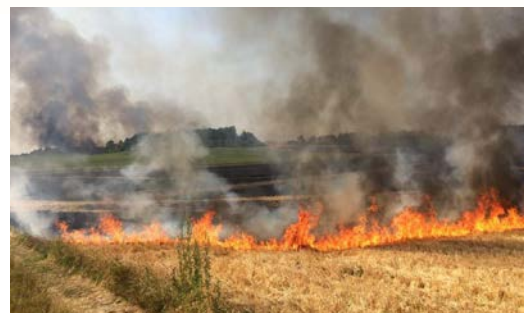
Feu de chaumes au contact de surfaces chaudes ou de friction avec des pierres