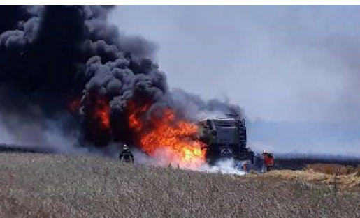
Feu de poussières accumulées à certains endroits