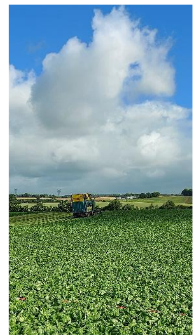
Récolte épinard