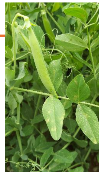
Mildiou sur pois