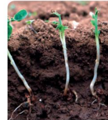
Destruction du bourgeon terminal sur pois

Insuffisants pour réguler des populations importantes de mouche des semis, mais à favoriser.