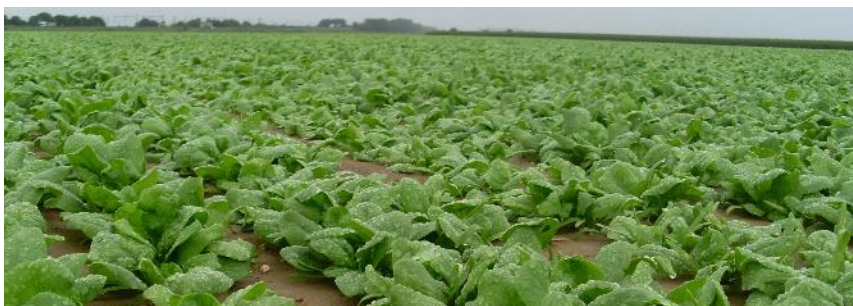
Parcelle d'épinards