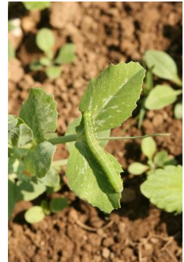
Chenille Noctuelle gamma