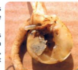
Galerie dans cotylédon de pois