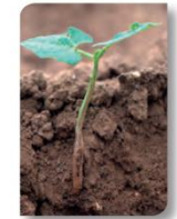
Sur haricot : Galeries dans le collet