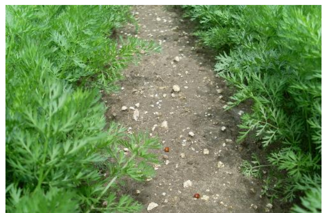
Coccinelles dans parcelle de carottes