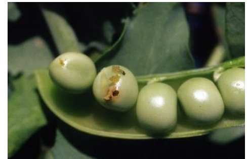
Tordeuse du pois