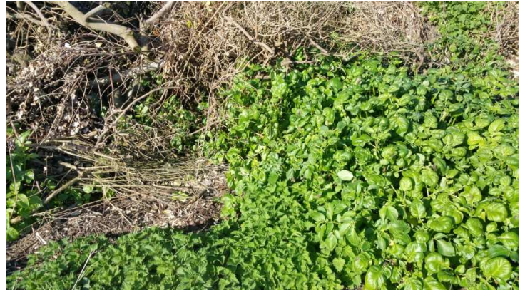
Repousses sur tas de déchets