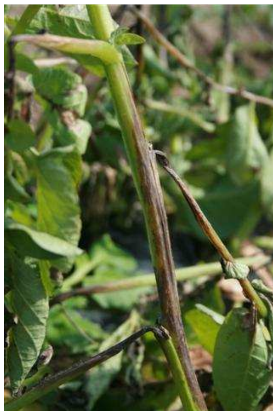
Mildiou sur tige

Le risque de développer du mildiou est encore très limité, mais la présence de mildiou dans l'environnement peut permettre les contaminations dans des situations défavorables (ombragées, présence de talus, exposition ouest...)