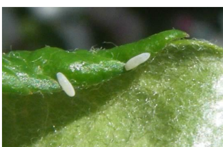
Œufs de syrphe