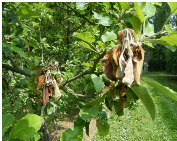
Moniliose sur fleurs

Les fleurs et les quelques feuilles sous-jacentes restent agglomérées en une masse sèche caractéristique.