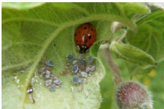
Coccinelle asiatique dans un foyer de pucerons cendrés