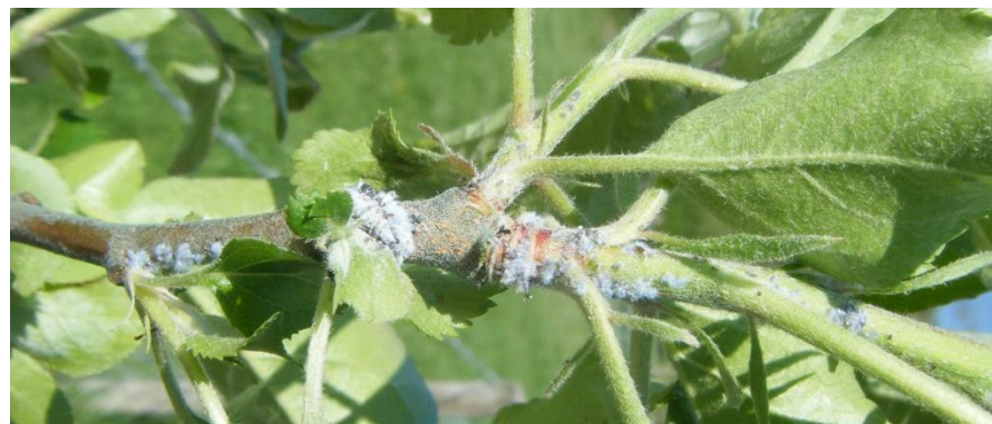
Migration des pucerons lanigères

Les Aphelinus mali , hyménoptères parasitoïdes des pucerons lanigères ont fait leur apparition en Pays de la Loire, mais toujours pas en Normandie ni en Bretagne.