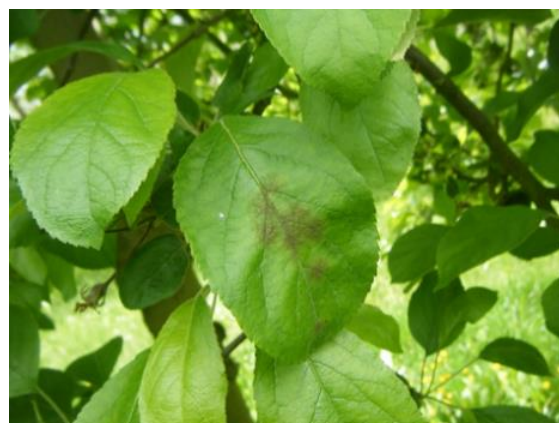
Taches de tavelure

Les taches de tavelure sur pommes à couteau et pommes à cidre sont observées dans les trois régions. Des repiquages de tavelure ont même déjà été observés en Pays de la Loire.