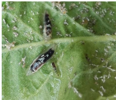
Larves de syrphe dans un foyer de pucerons cendrés