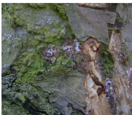
Cochenilles rouges du poirier