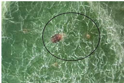
Acarien rouge et œufs d'été

En Normandie et en Bretagne, les populations restent faibles. En Pays de la Loire, les populations sont en légère augmentation.