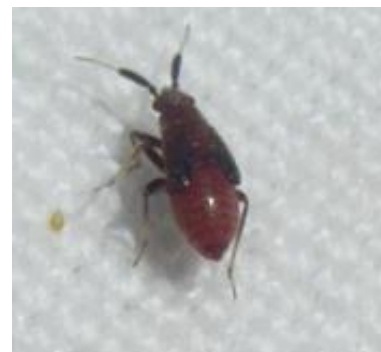
Larve d'Atractotomus : Punaise prédatrice