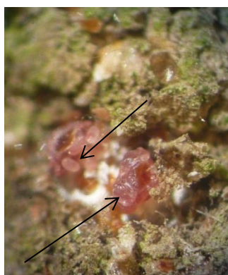
Femelle de cochenilles rouges du poirier avec œufs