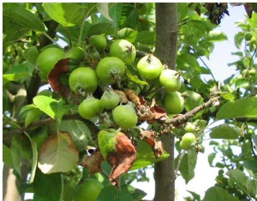
Dégâts de pucerons cendrés sur pomme

De plus des formes ailées de pucerons cendrés ont été observées dans les différentes régions, signe d'une migration prochaine vers le plantain.