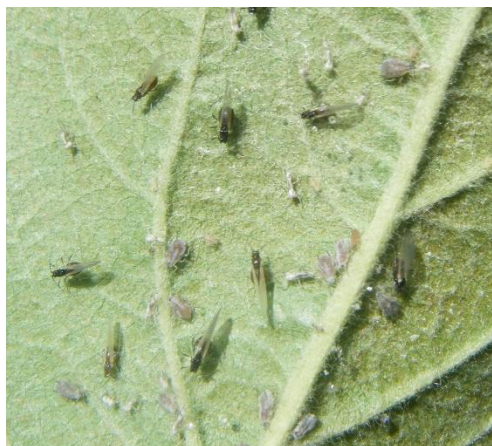
Pucerons cendrés ailés