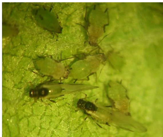
Pucerons verts non migrants

A suivre en fonction de l'augmentation des températures et de la présence des auxiliaires.