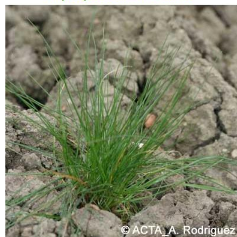
Vulpie queue-de-rat : Plantule

Cette enquête est issue d'une collaboration entre le Natural Resources Institute et Rothamsted Research (Royaume-Uni), en partenariat avec INRAE (UMR Agroécologie, Dijon, France) et Swiss No-Till et AgriGenève (Suisse).