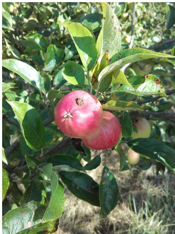
Dégâts de carpocapse

La durée entre la ponte et l'éclosion : nombre de jours pour atteindre 90°C jour en base 10 (au-delà de 20 jours les œufs ne sont plus viables).