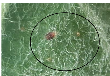
Acarien rouge et œufs d'été

Les acariens prédateurs sont en augmentation, ces auxiliaires ont un fort pouvoir de régulation des acariens rouges.