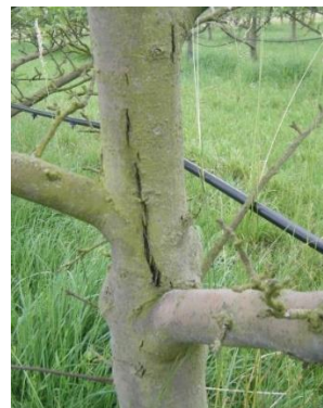
Dégât de cochenilles rouges du poirier