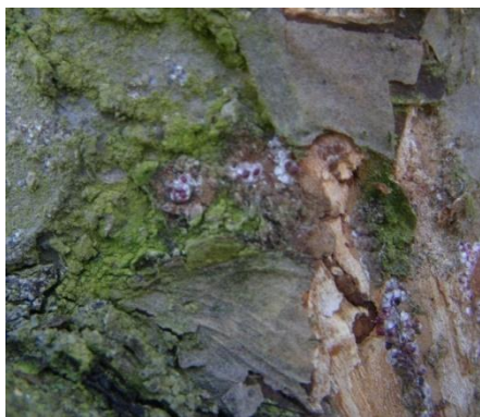
Cochenilles rouges du poirier