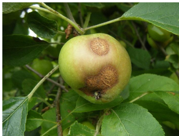
Taches de tavelure sur fruit

Dans les vergers où des taches apparaîtront, il y a un risque de contamination secondaire dès que la durée d'humectation du feuillage sera suffisamment longue pour que les spores puissent germer. Il faut aussi tenir compte des sorties de nouvelles feuilles pour raisonner la protection contre la tavelure.