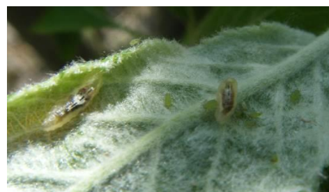
Larves de syrphes