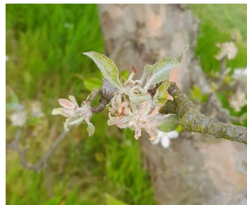
Symptômes sur bouquet floral

Dans les autres parcelles, l'intensité varie entre de rares taches jusqu'à une présence forte notée pour 3 parcelles (2 en Pays de la Loire : Judeline et 1 en Normandie : Petit Jaune).