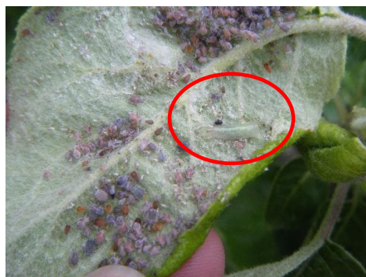
Larve de syrpe au sein d'un foyer de pucerons cendrés

Avec les températures fraîches, la faune auxiliaire se déploie doucement dans les parcelles et commence à s'installer : adultes, premières larves et premières pontes de coccinelles, œufs et larves de syrphes. En Bretagne, des forficules sont également observés au sein des foyers.