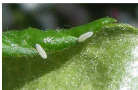
Œufs de syrphes