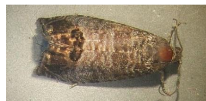
Papillon de carpocapse

Les captures de papillons mâles se poursuivent dans les trois régions.