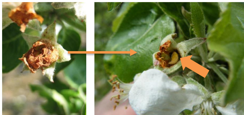
Dégâts sur bouton « clou de girofle » et à l'intérieur nymphe d'anthonome

Des dégâts de faible intensité (1 à 20% des bouquets touchés) sont observés dans plusieurs vergers en Normandie et en Bretagne. En l'absence de gestion, il peut être observé plus de 50% de boutons atteints.