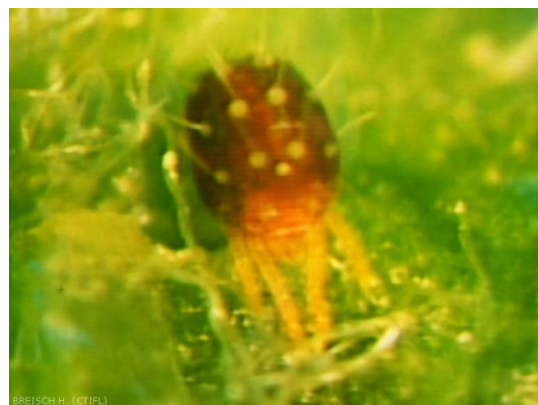
Acarien rouge

Les femelles adultes de l'acarien rouge (photo ci-contre) sont globuleuses et à peine visibles à l'œil nu (0.4 mm). Elles sont d'un rouge vif, parfois sombre, avec deux séries de tubercules dorsaux blancs portant des soies blanches. Les mâles rouge-orangé sont plus petits (0.3 à 0.35 mm). Ils sont allongés avec l'extrémité du corps conique. (source Ephytia)