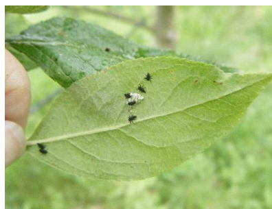
Adultes et toutes jeunes larves de coccinelles

Il existe de nombreuses espèces de coccinelles (coccinelles à 7 points, à 2 points, à 14 points, Chilocorus sp., Stethorus sp., ...). Elles consomment des pucerons, des aleurodes et des larves de toutes sortes. Chilocorus sp. consomme des cochenilles, et Stethorus sp. consomme des acariens. Le stade le plus efficace est le stade larvaire. La larve consomme jusqu'à 60 pucerons/jour si la T° > 12°C.