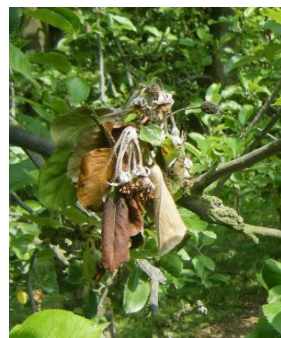
Dégâts de moniliose sur fleurs

http://ephytia.inra.fr/fr/C/22095/Pomme-Monilinia-laxa-moniliose