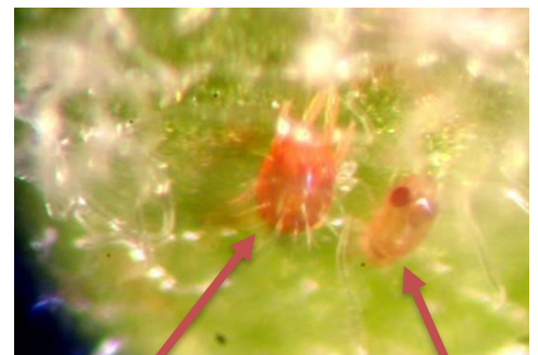
Acarien rouge et acarien prédateur

Ce bulletin est une publication gratuite, réalisée en partenariat avec