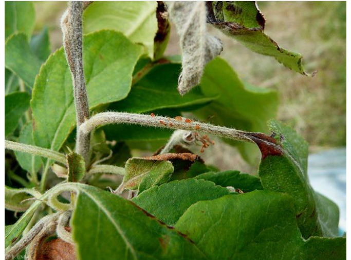
Exsudat sur le pétiole et nécrose sur la nervure centrale de la feuille de pommier - Feu bactérien

Les organes atteints (fleurs, pousses, ...) se nécrosent et noircissent. On observe une production d'exsudat : gouttelette blanc jaunâtre puis ambrée. Ce liquide qui contient la bactérie est collant.