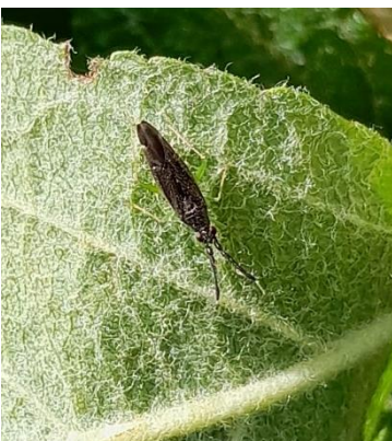
Adulte d' Heterotoma

Des acariens prédateurs ainsi que des punaises prédatrices des genres Atractotomus et Heterotoma (adultes et larves) sont présents et actifs dans les vergers. (Cf BSV n°13 pour la description de ces auxiliaires)