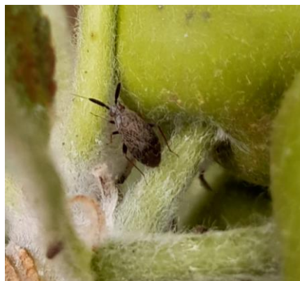
Adulte d' Atractotomus