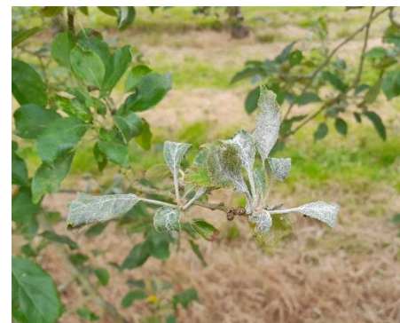
Oïdium sur Douce Moën

Une présence faible à moyenne est signalée sur des variétés plus ou moins sensibles : Douce Moën, Judeline, Petit Jaune, Judor, Binet Rouge, Peau de Chien et Pirouette. Une présence forte est notée sur Douce Moën dans un verger en Normandie