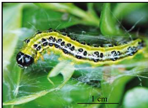
Une chenille de pyrale du buis

Dégâts et plantes hôtes P3 Situation sanitaire Moyens de lutte