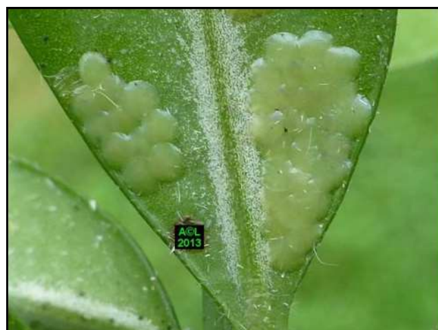
Œufs de pyrale du buis