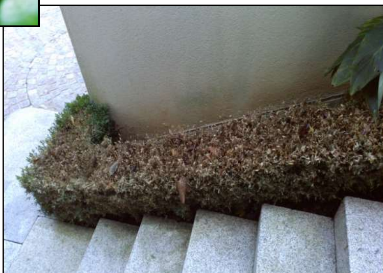
Dégâts de pyrale du buis sur buis de bordure

Retrouvez les BSV sur le site de la Chambre Régionale d'Agriculture ou le site de la DRAAF www.bulletinuvegetal.synagri.com http://draf.bretagne.agriculture.gouv.fr