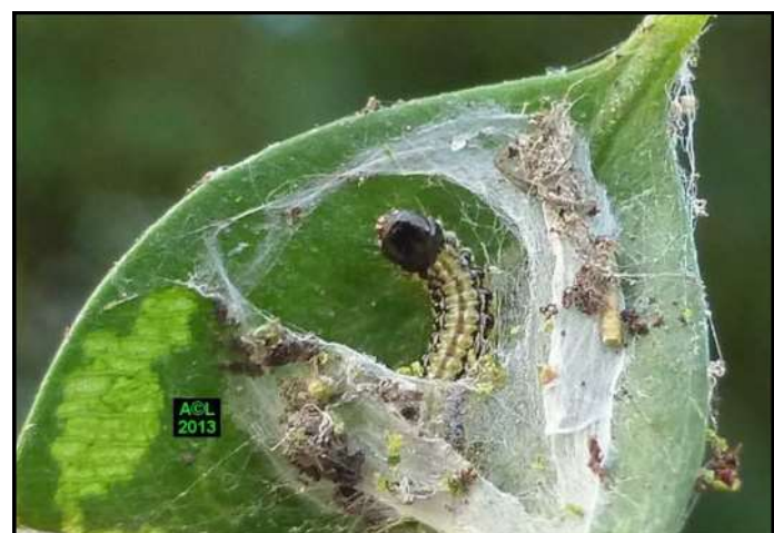
Chenille de pyrale du buis dans son logis hivernal