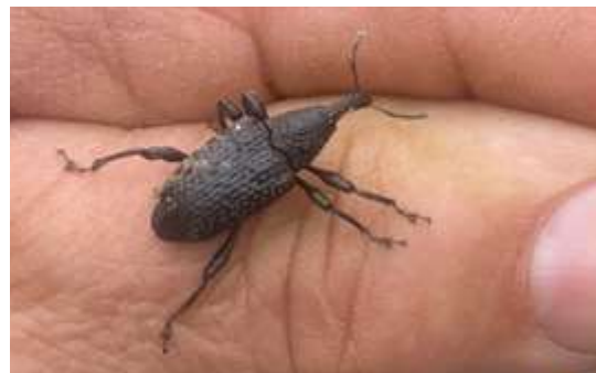
Un adulte de charançon du figuier

Pour en savoir plus sur la biologie de l'insecte cliquez ICI.