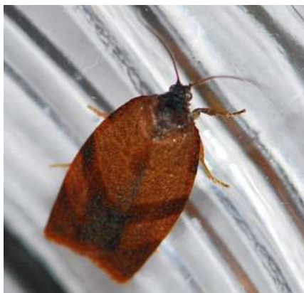
Un papillon de tordeuse de l'oeillet

Les captures sont dorénavant faibles. Le premier vol est terminé.