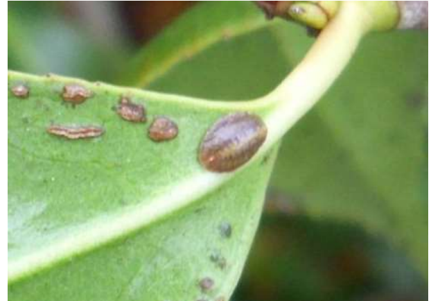
Une cochenille sur feuille de camélia

- La lutte biologique peut être mise en place, vous trouverez sur ce lien (page 13) les auxiliaires disponibles.