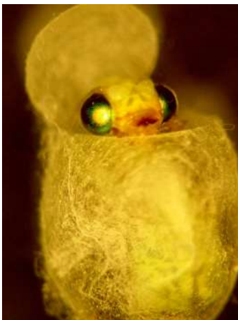
Chrysope adulte en pleine émergence

L'activité des auxiliaires est élevée. Les auxiliaires les plus actifs sont les syrphes (larves et adultes observés). On observe aussi fréquemment, des larves et adultes de coccinelles ainsi que des pucerons parasités par des micro-hyménoptères. Des chrysope adultes sont aussi notés mais à moindre mesure.