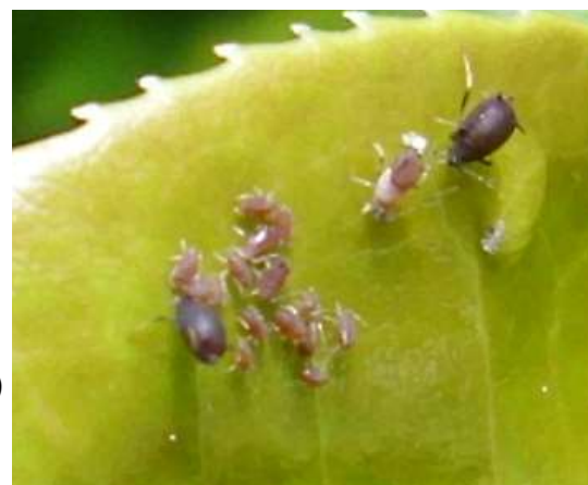
Pucerons sur jeunes feuilles de camélia

Vous trouverez ICI un document sur les parasitoïdes contre les pucerons en cultures ornementales.