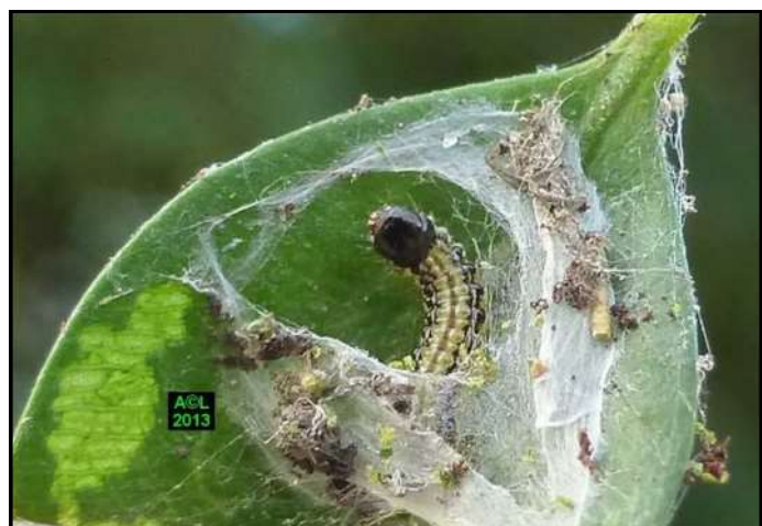
Chenille de pyrale du buis dans son logis hivernal