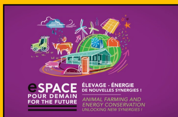
Illustration disponible en vidéo sur le YouTube du Space.

L'Espace pour Demain a fait peau neuve en 2023 ! En plus de la présentation de matériel et de témoignages, des ateliers ont été proposés dans l'espace "expert". Vous pouviez y retrouver des échanges autour des économies d'énergie, l'optimisation des contrats d'énergie ou encore l'évolution de la loi sur les énergies renouvelables.